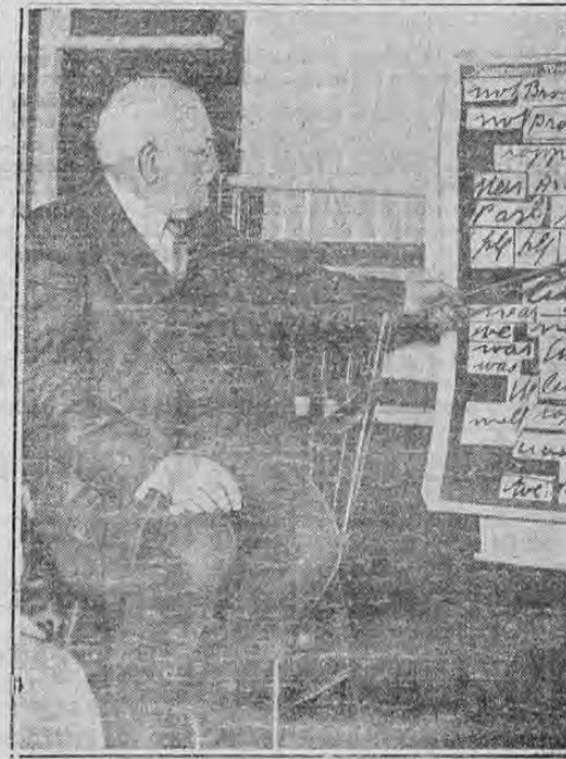
Se encontraron Albert S. Osborn, el experto calígrafo del Estado de New Jersey, que ha examinado las notas del rescate enviadas a Lindbergh por el rapto y la escritura aceptada por Hauptmann...